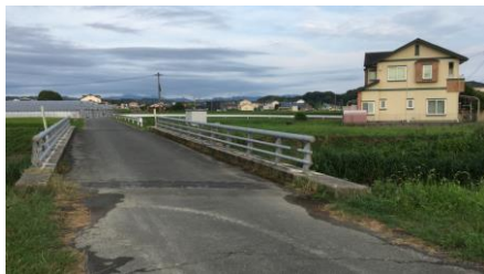
写真中央が上三ツ枝橋。(左側が親水公園)上三ツ枝橋の右側(下流側)約20mの位置に大津橋がありました。

馬車で石が運びよせられます。晴れた寒い朝「オミキ用意せよ」との事。清酒一升、塩、イリコもお盆にのせて持って行きます。湯呑5~6個との事です。父は酒を川端に一升ビンから撒き塩もまいて、仕事をする人達4~5人に父が湯呑についていました。事故の無い様との行事ではなかったでしょうか？ (次号に続く)